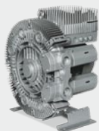
G-BH7 с частотным преобразователем