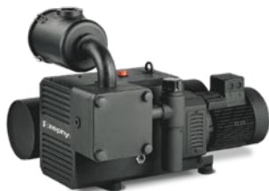
C-VLR (для деревообрабатывающей промышленности) ZEPHYR